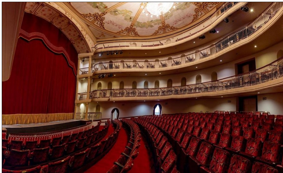
Foto: Interior do Theatro São Pedro.